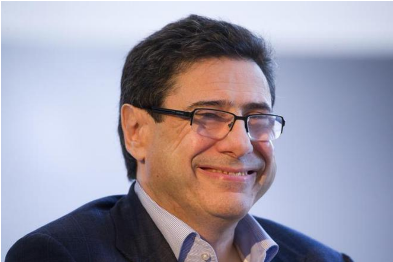
Philippe Aghion en 2016.

Leur tribune vise directement les études réalisées sur les impacts des inégalités de ces mesures. Le déclencheur a été, à n'en pas douter, la dernière étude de l'Observatoire français des conjonctures économiques (OFCE) sur l'impact des mesures fiscales, publiée le 5 février dernier et résumée ici . Celle-ci confirme que, malgré les mesures en faveur des classes moyennes adoptées sur la pression du mouvement des « gilets jaunes », les plus fortunés restaient les grands gagnants de la politique fiscale du gouvernement et que, en regard, les plus pauvres étaient les grands perdants. Entre 2018 et 2020, affirmaient les économistes de l'OFCE, le niveau de vie des 5 % les plus riches progresserait de 2,6 % alors que celui des 5 % les plus pauvres se contracterait de 2,1 %. Des riches plus riches et des pauvres plus pauvres, le tout par la grâce de la seule politique fiscale d'Emmanuel Macron.